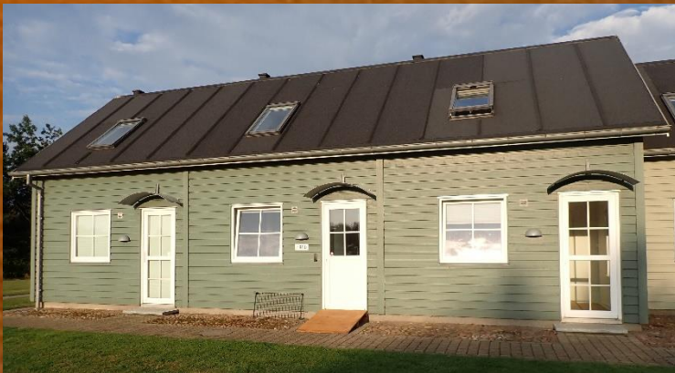
Landal Seawest huisje 91D